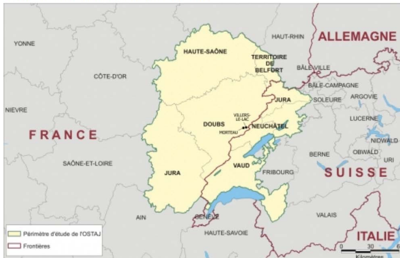
Figure 1. L'Arc jurassien franco-suisse.